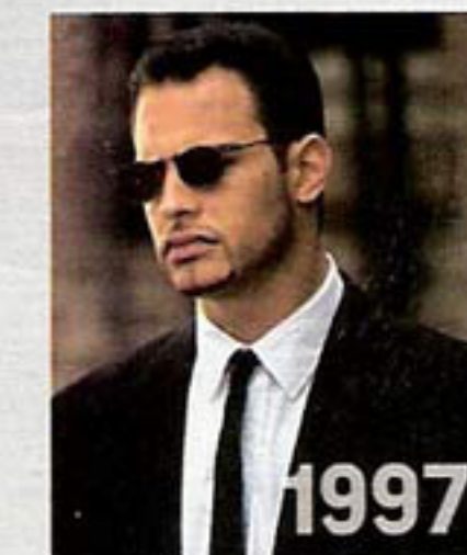
KNOCKIN' ON HEAVEN'S DOOR Mit Til Schweiger in dem deutschen Roadmovie à la Tarantino