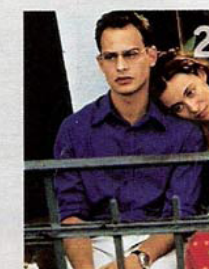
IM JULI Auf der Suche nach der großen Liebe allerdings nicht Idyll. Und war ... Zum Seufzen so