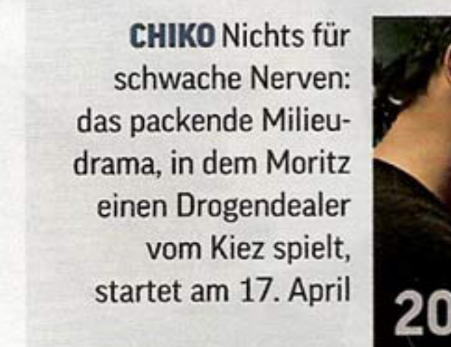
CHIKO Nichts für schwache Nerven: das packende Milieudrama, in dem Moritz einen Drogendealer vom Kiez spielt, startet am 17. April