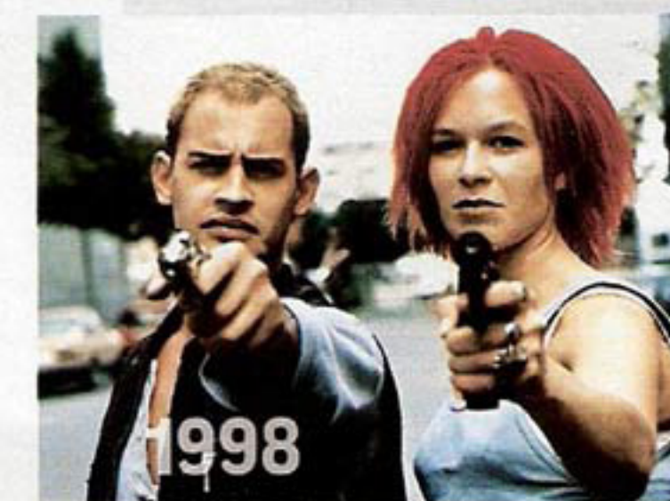
LOLA RENNT Durchbruch für Moritz und Franka Potente mit dem Kultfilm, der mit Preisen überhäuft wurde